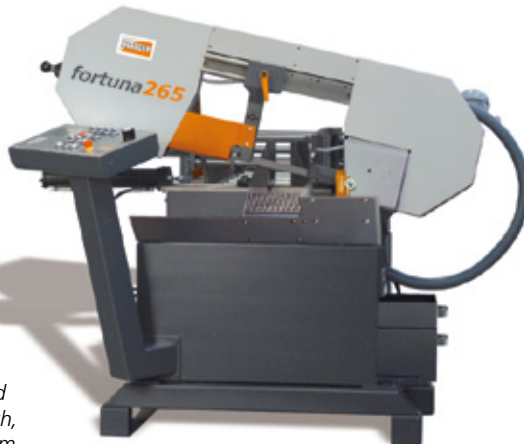
fortuna265 Allround und unverwüstlich, bis Ø 265 mm