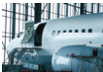
Luft- und Raumfahrt